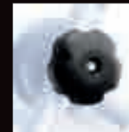
CHIUSURA CON POMELLO CLOSE-UP WITH KNOB