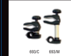
ART. 693 BRACCETTI CON CHIUSURA A CHIAVE LOOK BIKE GRAB ARMS