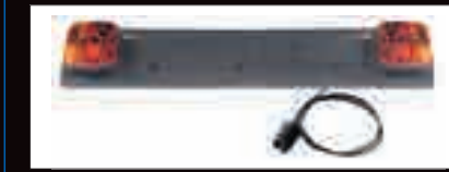
ART. 394 PORTATARGA COMPLETA DI FANALI E SPINA 7 POLI LUNGHEZZA CAVO: 1,5 MT NUMBER PLATE HOLDER COMPLETE WITH LIGHTS AND 7 PIN PLASTIC PLUG CABLE LENGTH: 1,5 MT