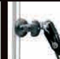
TENDITORE AUTOBLOCCANTE A CRICK SELF-LOCKER HOLDER