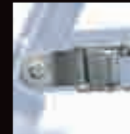
FIBBIA IN ACCIAIO STEEL BUCKLE