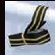
CINGHIA DI SICUREZZA SAFETY STRAP