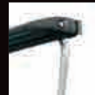
BLOCCAGGIO CHIAVE ANTIFURTO PORTASCI (ART. 379 - 379/A) ANTI-THEFT LOCKING (ART. 379 - 379/A)